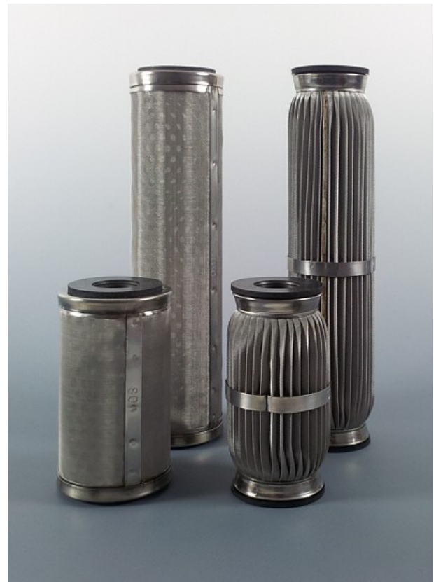
Verschiedene Causamesh Ausführungen Zylindrisch / Plissiert

Die Causamesh CMG Edelstahl-Filterkerzen stehen in zwei Ausführungen zur Verfügung: Zylindrisch und Plissiert.